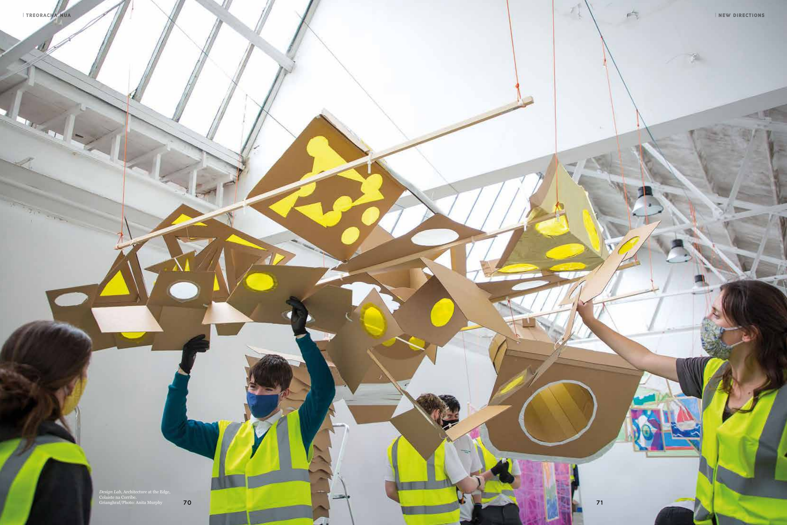
Design Lab, Architecture at the Edge, Colaiste na Corribe.